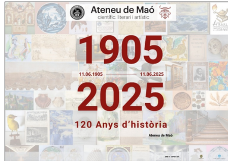
120 aniversari Ateneu

Ateneu de Maó científic, literari i artístic Des de 1905