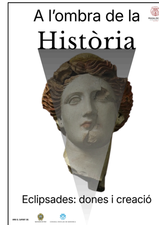
Dia de la dona 2026