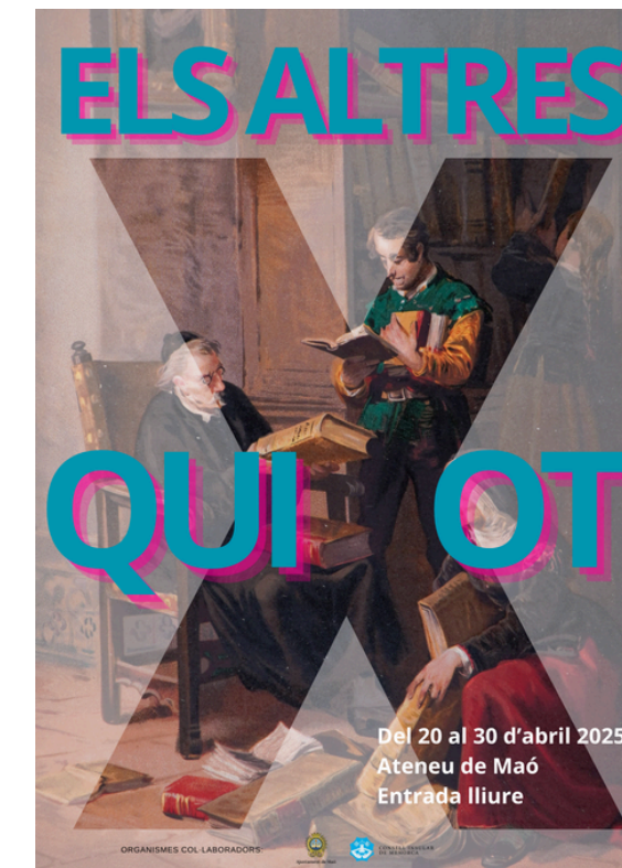
Dia del llibre 2026